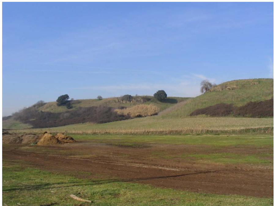
Riserva naturale Decima Malafede