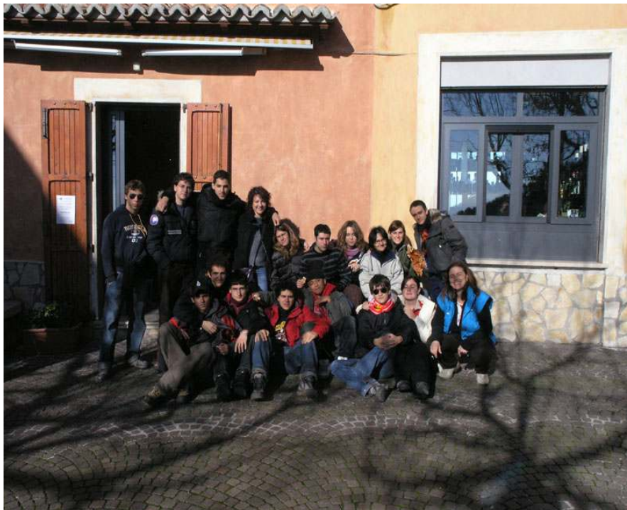
L'ultimo giorno dopo la bella conversazione con gli studenti dell'Università dell'Arkansas

Il gruppo alternanza scuola lavoro ha realizzato i lavori previsti articolando le tematiche scelte individualmente in modo più complesso. La maggior parte dei ragazzi infatti ha pensato di utilizzare il proprio lavoro anche come percorso d'esame e ha cercato quindi di collegare il tema del "paesaggio" ai programmi svolti durante l'anno scolastico: una sintesi non sempre facile ma che è risultata particolarmente stimolante.