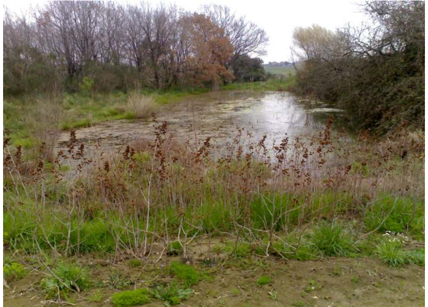
Riserva Tenuta dei Massimi e stagno del Cenerino

Per raggiungere l'area i ragazzi hanno utilizzato i mezzi pubblici per l'avvicinamento e un servizio di navetta all'interno della riserva, grazie alla disponibilità dell'Ente e dei Guardiaparco.