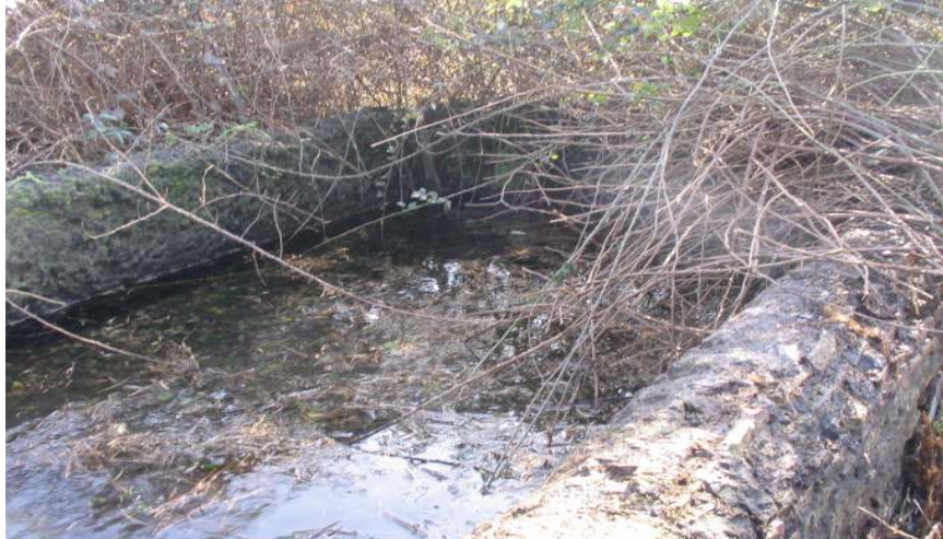
Il fontanile prima della ripulitura

I gruppi hanno sviluppato entrambi i due progetti con i Tutor di RomaNatura per un totale di attività di 4 settimane collocate temporalmente due nel primo e due nel secondo quadrimestre. Le attività previste secondo un calendario preveda attività "su campo":