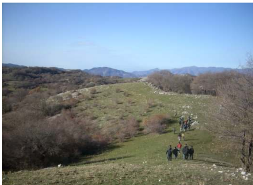
Il Parco dei Simbruini in località Prataglia nei pressi della Locanda dell'Orso

Per arrivare alla sintesi che di per sé il concetto di "paesaggio" richiede abbiamo intrapreso un percorso senza trascurare, ancora una volta, l'aspetto emotivo, l'evocazione di una condivisione di valori.